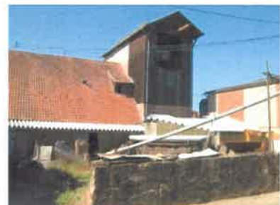
Le corps de ferme concerné