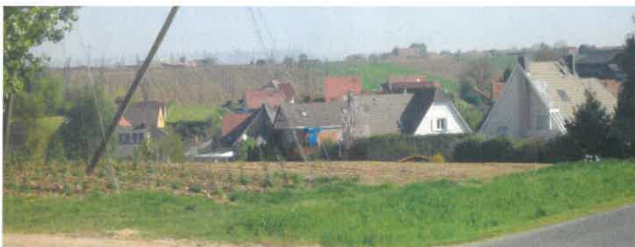
Vue depuis l'entrée Sud sur les constructions de la rue des peupliers