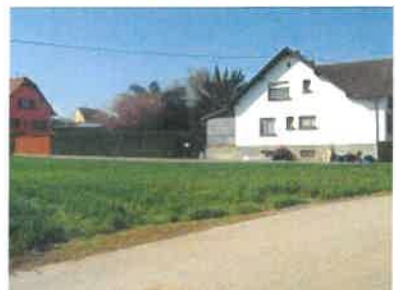
Dents creuses le long de la rue des Peupliers