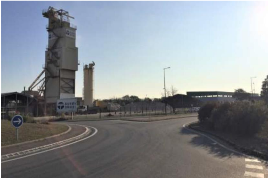
Site actuel

Le site est actuellement classé en zone UXi qui limite la hauteur des constructions à 20 mètres. Or la centrale d'enrobés actuelle présente une hauteur de 34 mètres. Le projet de nouvelle centrale devrait avoir une hauteur de 45 mètres hors ouvrages techniques du type garde-corps, cheminées, etc. ce qui nécessite de modifier le règlement d'urbanisme applicable.